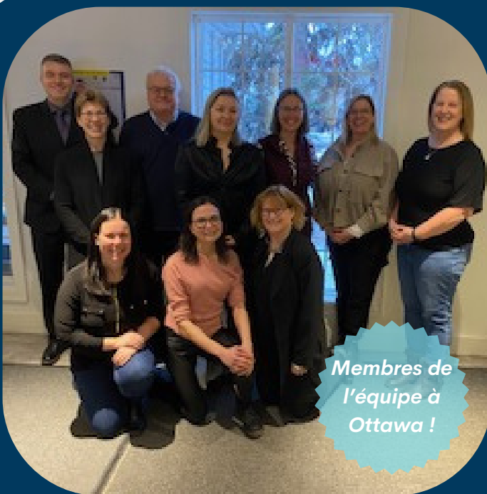
Membres de l'équipe à Ottawa !